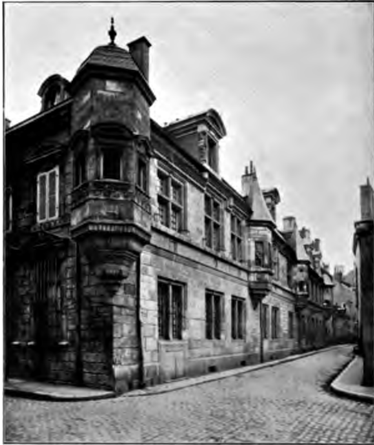
Hôtel Stéphen Liégeard.

Cette fois encore, les partisans des vieilles méthodes ne capitulèrent pas sans une honorable résistance. Le bâtiment principal de l' Hôtel Joly de Blaisy (rue Chabot-Charny, 32), qui appartient au commencement du XVI e siècle, a gardé la haute toiture, la porte en accolade, l'escalier tour-